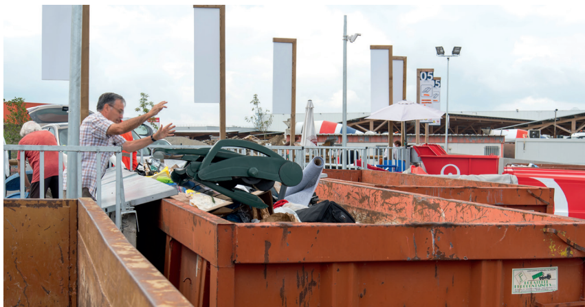
LA NOUVELLE DÉCHÈTERIE DE PLAISANCE-DU-TOUCH

➔ Localisez la déchèterie la plus proche de chez vous !