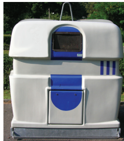
Récup' TRI EN MÉLANGE